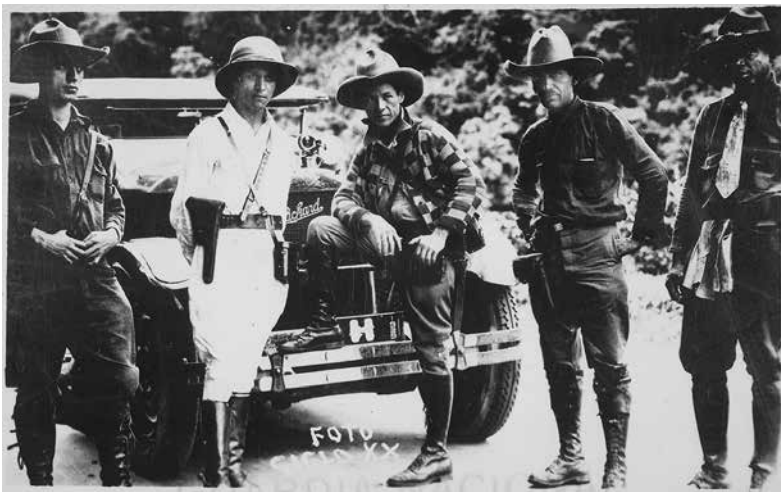
Augusto César Sandino y su personal.